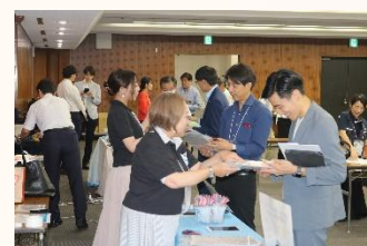
▲「PRブース」商品の展示