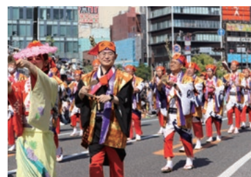
▲博多どんたく港まつり