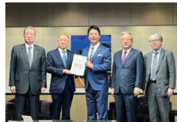
▲ふくふく懇談報告書の提出