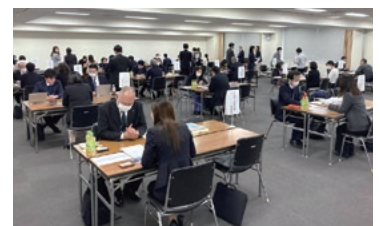
▲学校と企業との就職情報交換会