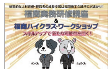
▲福商実務研修講座&福商ハイクラス・ワークショップ