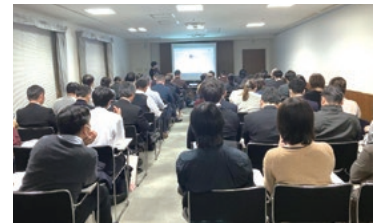
▲デジタル化・DX推進セミナー