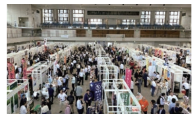
▲Food EXPO Kyushu