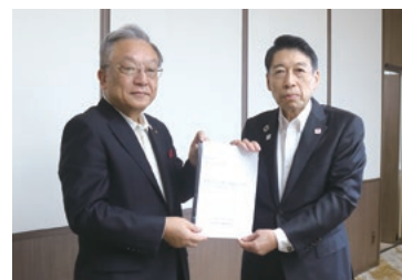
▲福岡県知事への要望書提出