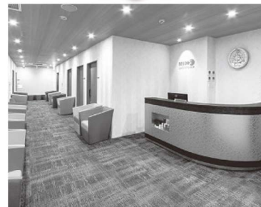
▲施設健診は、男性・女性・内視鏡の各専用クリニック でご受診いただけます(写真は女性専用クリニック)

通常価格 11,440円 ~ 割引価格 ▼ 5,700円 ~ 約50%オフ (税込)