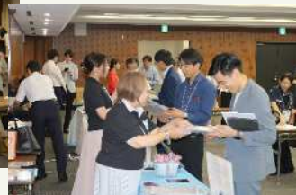
▲「PRブース」商品の展示