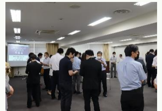
過去の交流会の様子