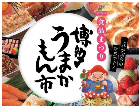
※昨年度のイメージ画像です。

地場食品の「味の良さ」「新鮮さ」「楽しさ」を PR し“ふるさとの味”の発見や消費拡大を目指します。