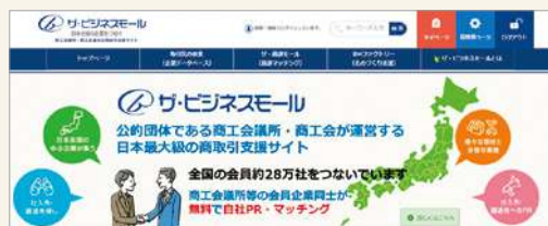
ザ・ビジネスモールHP

全国の商工会議所・商工会で共同運営している日本最大級の商取引支援サイトです。全国の約28万社の企業が登録。取引先の検索や自社PR、商談等が可能です。