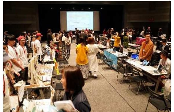
※写真（会場の様子）はイメージです。

今回は、クリエイターの作品を展示するブースを設けて、百貨店や商業施設、食品製造業等に来場していただき、 事前予約制のマッチング（商談） を実施します。