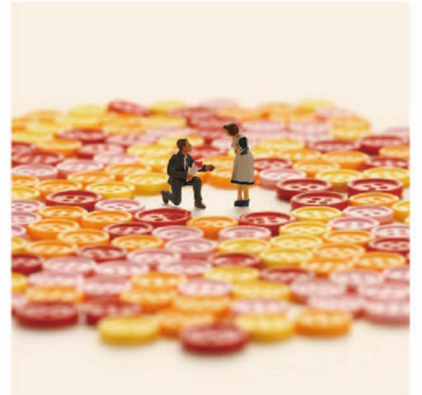
裁縫のプロポーズ