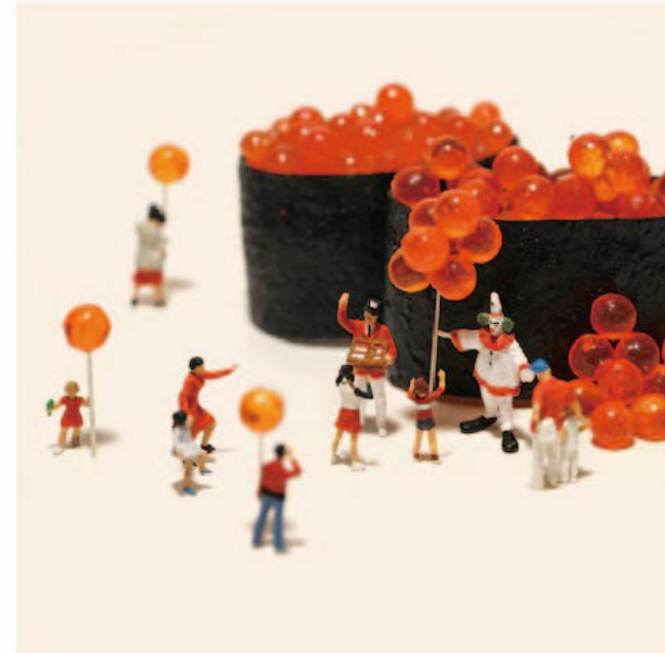
風船はいくらでもありますよ