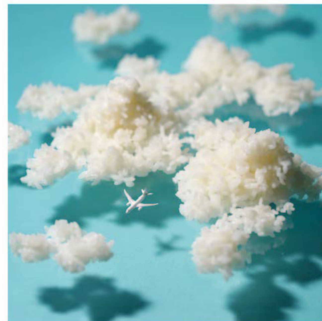
ハブアライス トリップ!