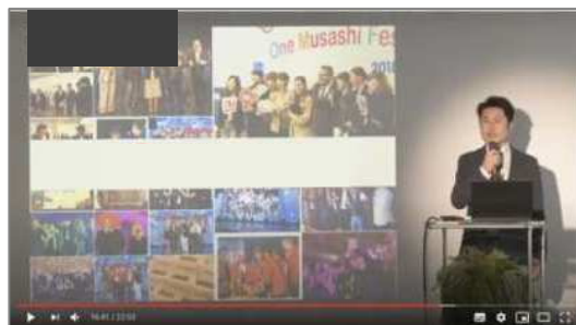
Web合同企業説明会 (イメージ)