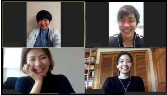
オンラインモグジョブ（イメージ）

モグジョブでマッチングした学生と、 Web会議ツール「Zoom」を使って交流できる オンラインイベント。 企業さまのオフィスやご自宅からご参加いただき、 学生とのコミュニケーションを通じて、 自社をPRしていただけます。