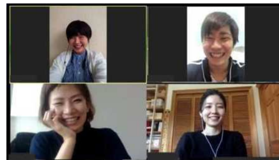
オンラインモグジョブ (イメージ)