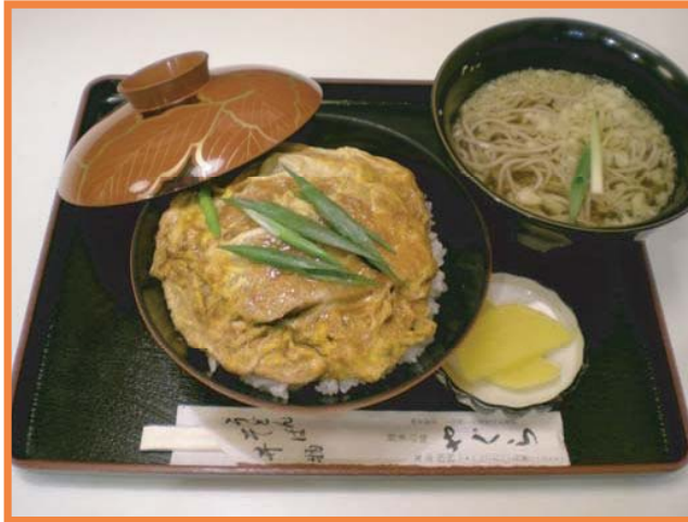
▲かつ丼定食 (写真はそば付き)

会議室まで出前致します メニュー・人数・ご予算 ご相談くださいませ (お弁当は800円～) 定食・セットメニュー以外に 単品もございます