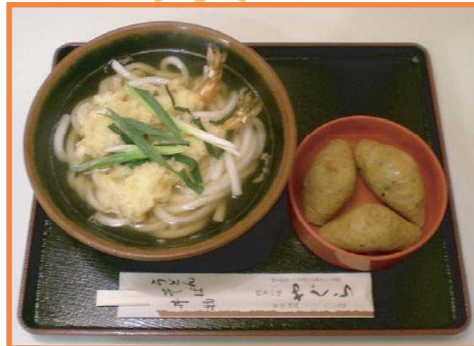
▲天ぷらうどんセット (いなり付き)