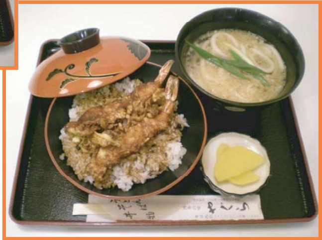
▲天丼定食 (写真はうどん付き)