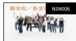
異文化多文化おもてなし