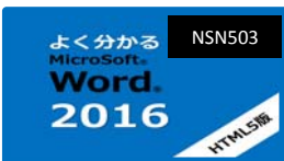
よく分かるWord 2016 (HTML5)