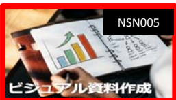
ビジュアル資料作成