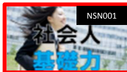
社会人基礎力コース