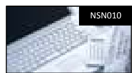
目標管理実践コース