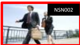
ビジスマナーの基本