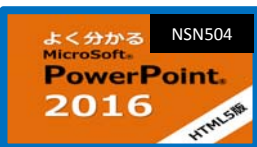
よく分かるPowerPoint 2016 (HTML5)