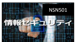
情報セキュリティ