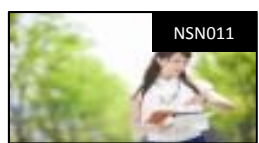
メンタルヘルスマネジメント (ラインケア)