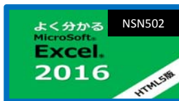
よく分かるExcel 2016 (HTML5)