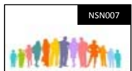
パーソナルカラー&ヘアメイク