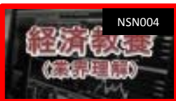
経済教養(業界理解)