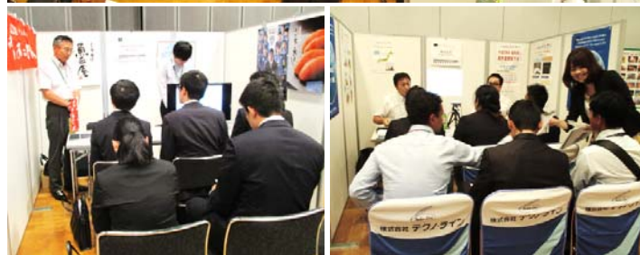
▲出展企業の説明に対し熱心に耳を傾ける学生たち