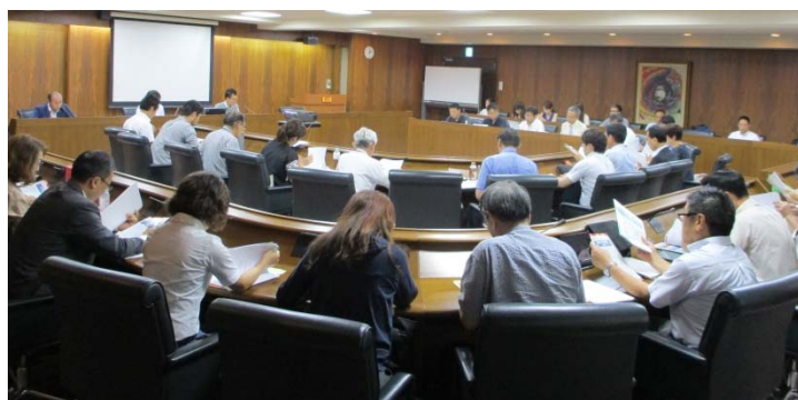
▲担当官の話に真剣に耳を傾ける参加者たち

当日は、福岡労働局の担当者を講師に迎え、キャリアアップ助成金と人材開発支援助成金について紹介いただく共に、福岡県地域ジョブ・カードセンター担当者より、本制度を活用した雇用型訓練の概要と導入のメリット等について説明した。フェア終了後には個別相談会を実施。多数の参加者が来場し、人材育成の取り組みへの関心の高さが伺えた。