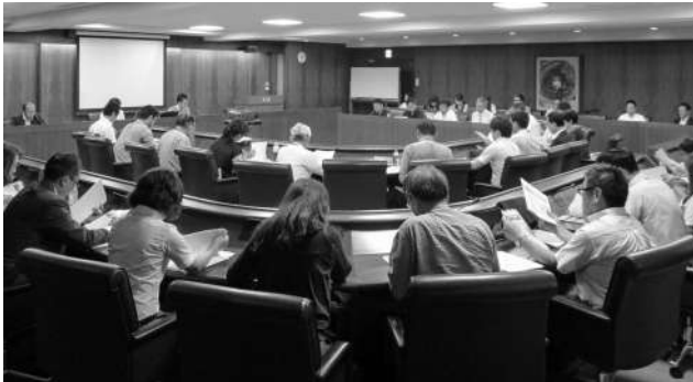
フェア終了後に実施した個別相談会には、たくさんの来場があった

当所が設置する福岡県地域ジョブ・カードセンターは8月24日、「ジョブ・カード制度」の普及を目的にジョブ・カード制度普及促進フェアを開催。54名が参加した。