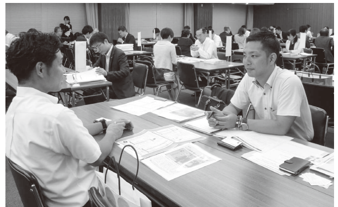
【第一部】採用活動の現状や求人内容について説明する参加者

部では学校と企業の双方が自由に交流するための立食交流会を開催。第一部、二部ともに、積極的な情報交換が行われていた。