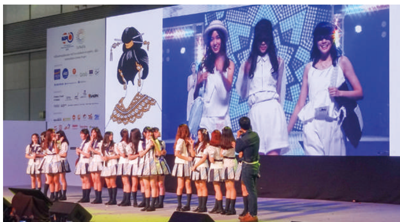
福岡県の魅力をPRするBNK48

「レストランにおける外国人受入環境づくり」、「外国人に向けた食を通じた九州の魅力発信」、「国内外観光客誘致の為の食情報の発信」を連携して行い、九州の「食」を通じた観光の活性化を図るというもの。