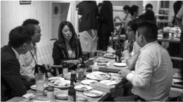
参加者同士、活発な交流が行われた

福商ビジネス倶楽部は8月29日、ハワイ発の大人気レストラン「エッグスンシングス」にて8月例会「納涼会」を開催。90名が参加した。