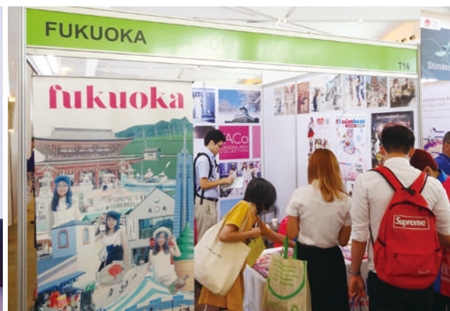
出展ブースでのPRの様子