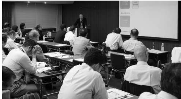
県内企業の成果発表に熱心に耳を傾ける参加者

当所は9月5日、ジェトロ福岡と共催で「福岡県企業の実例に学ぶ 新輸出大国コンソーシアム事業活用セミナー」を開催。66名が参加した。